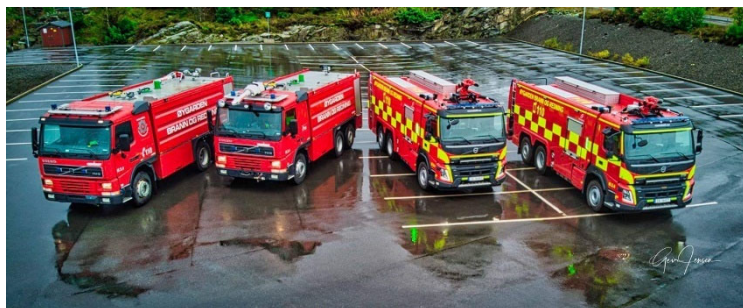
To gamle og to nye tankbilar.

Med ein aldrande bilpark følgjer det kostnader til reparasjonar og vedlikehald. Gleda var stor då vi seinhausten 2020 kunne ta i mot to ny mannskapsbilar og to nye tankbilar, til erstatning for dei gamle ved Dalsneset og Skogsskiftet brannstasjonar. Det vart og nytta fondsmidlar for kjøp av nytt frigjeringsverktøy, brannkle og batteridrivne vifter for ventilering av bygg.