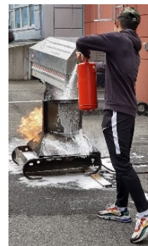
Brannvernopplæring for einslege mindreårige flyktingar

I samarbeid med flyktingtenesta gjennomfører vi teoretisk og praktisk brannvern-opplæring av alle flyktingar i kommunen sitt introduksjonsprogram. 15 flyktingar fekk slik opplæring i sommar på Ågotnes brannstasjon. Vi hadde og ein eigen brannvern-opplæring for 7 einslege mindreårige flyktingar i sommar. Det er vidare gjennomført 3 heimebesøk i utvalde bustader for flyktingar i 2020.