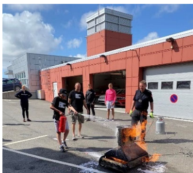
Bilete frå Burn Camp, ØBR