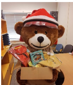
Bjørnis med premiar til julekonkurransane

Vi gjennomfører kvart år fleire brannførebyggjande kampanjer med stand og annan oppsøkande aktivitet. Av smittevern hensyn vart Brannvernuka, Hyttekampanjen og Aksjon boligbrann gjennomført digitalt i 2020. Det vart lagt ut brannverninformasjon og konkurransar på facebook og nettsida vår. Open brannstasjon, som er ein del av Brannvernuka, vart avlyst, som følgje av pandemien. I sommar besøkte vi to campingplassar i kommunen. Vi kontakta bebuare på campingplassen med informasjon om korleis ein kan sikre seg mot brann i campingvogna/campingbilen. Aksjonen avdekte eit stort behov for informasjonsarbeid retta mot campingvogn-/bil eigarar.