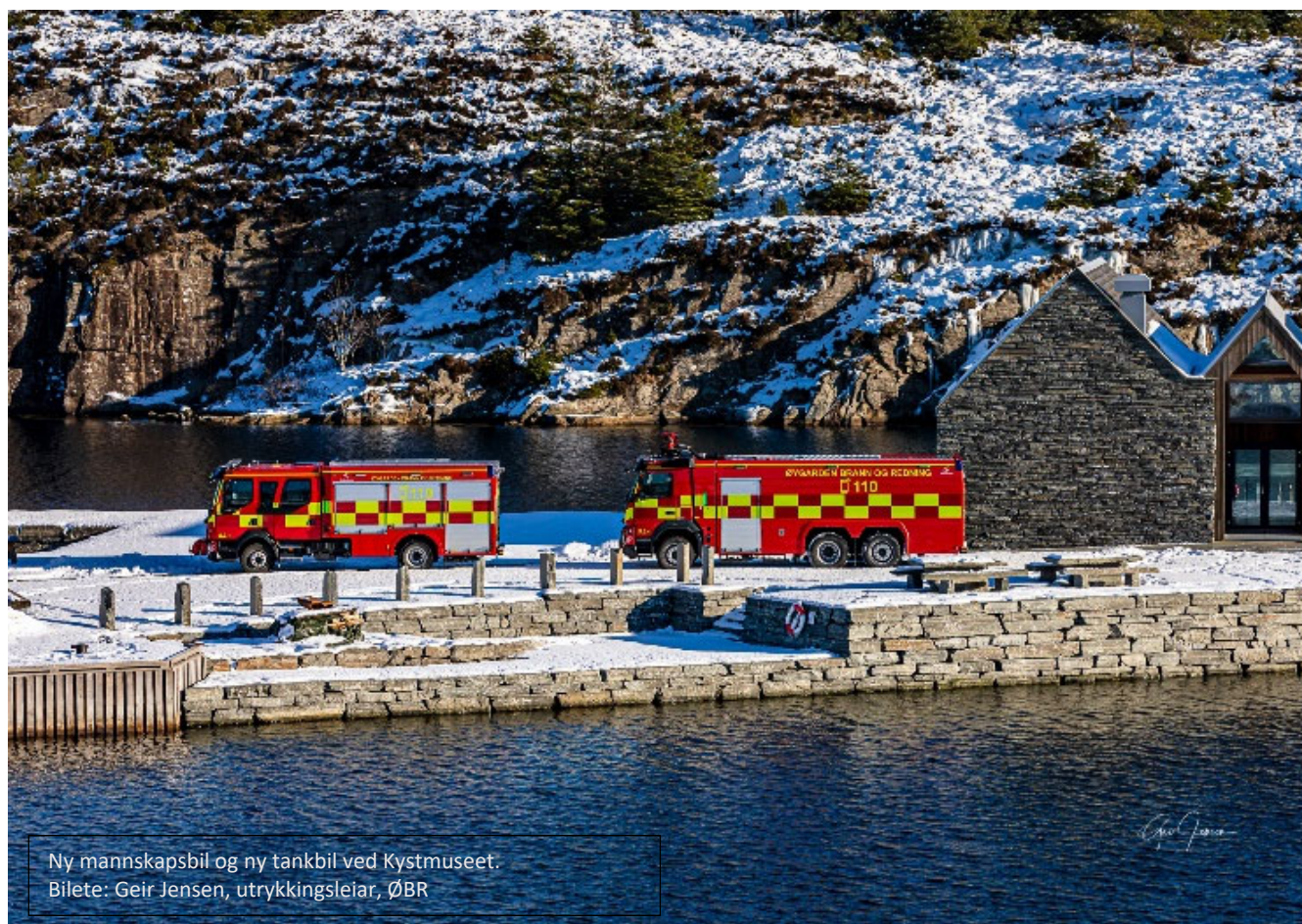
Ny mannskapsbil og ny tankbil ved Kystmuseet.