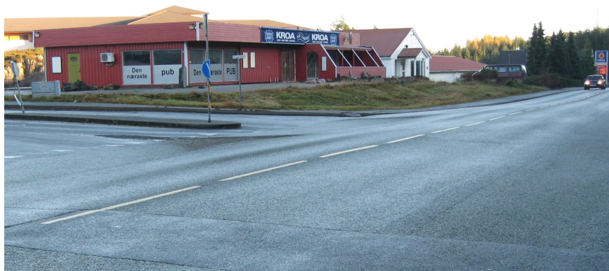
Foto: Husa langs riksvegen

I planforslaget legg ein til rette for ei opprusting av eksisterande sentrum og ei høgare utnytting av tomtene. Heile sentrumsområdet har i dag ein utnytting på 41 % ( 100% *bruksareal / tomteareal). Planforslaget legg til rette for ei utnytting på 120% dvs at ein kan byggja ca 30 000 m 2 innafor planområdet i tillegg til dagens areal som er på 16200 m 2 . Parkeringsareal delvis under bakken på ca 18000 m 2 kjem i tillegg. Nybygg skal såleis kunna oppførast i 3 etasjar med forretningar i 1 etg, kontor /service i 2 etg, bustadar på toppen og parkering under bakken.