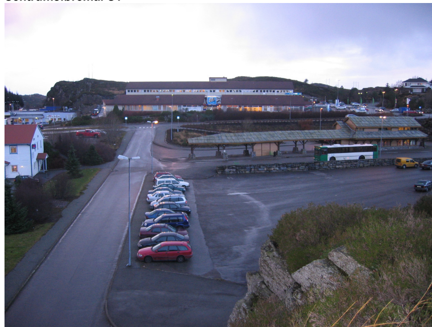
Foto: Senterområdet med dagens bussterminal