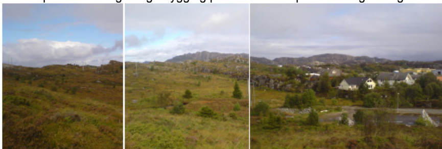
Planområde for bustadområde B1

Det meste av området (130 daa) er i kommuneplanen avsett til LNF-område, men delar av området er foreslått som utvidingsområde for bustadområdet Be 3. Naturen er kystlynghei og har ein del eksponerte høgdedrag som er synleg frå større deler av planområdet. Det meste av området ligg i dag innafor støysona til motocrossbana. I planforslaget foreslår vi at motocrossbana vert flytta. Dermed går støysona ut, og området kan leggjast til rette for bustadbygging. Då området ligg sentrumsnært, foreslår ein ei relativt høg utnytting av området. Ved utbygging av området bør ein ta omsyn til eksisterande natur og landskapskvalitetar og unngå bygging på dei mest eksponerte høgdedraga.