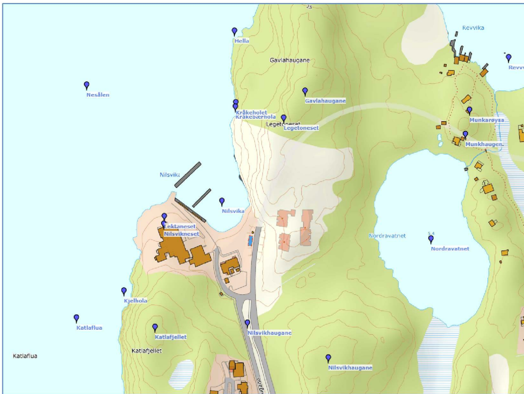
Figur 2 Utsnitt frå Hordanamn