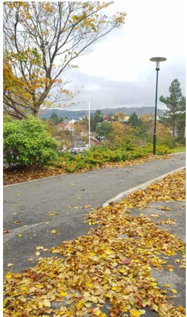
Haust ved Fjell rådhus, Fjell