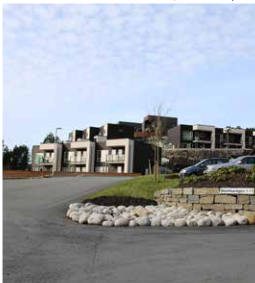
Blommen på Kolltveit, Fjell