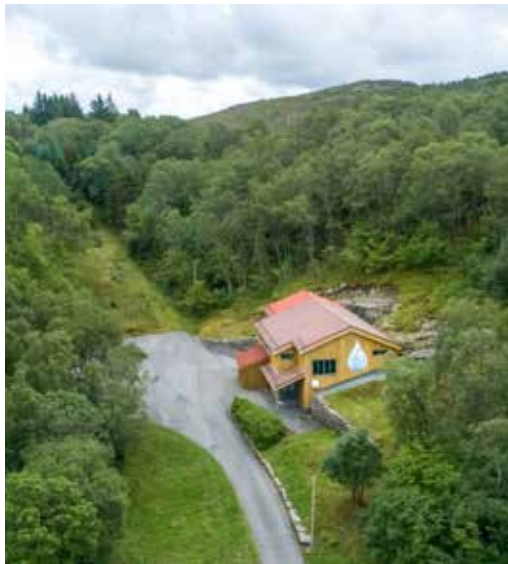
Kørelen vassverk, Sund