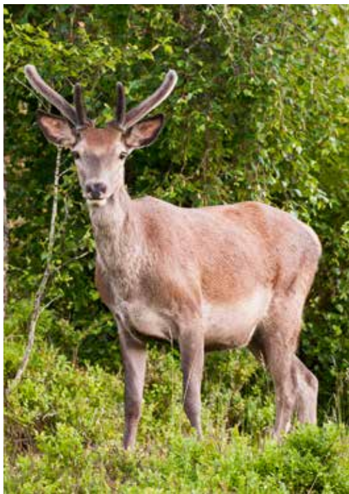
Hjort på Knappskog, Fjell

Oppdatert informasjon vil du finna på: nyeoygardenkommune.no og Facebook-sida vår.