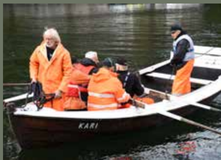
Landnotkast i Kjereide, Sund