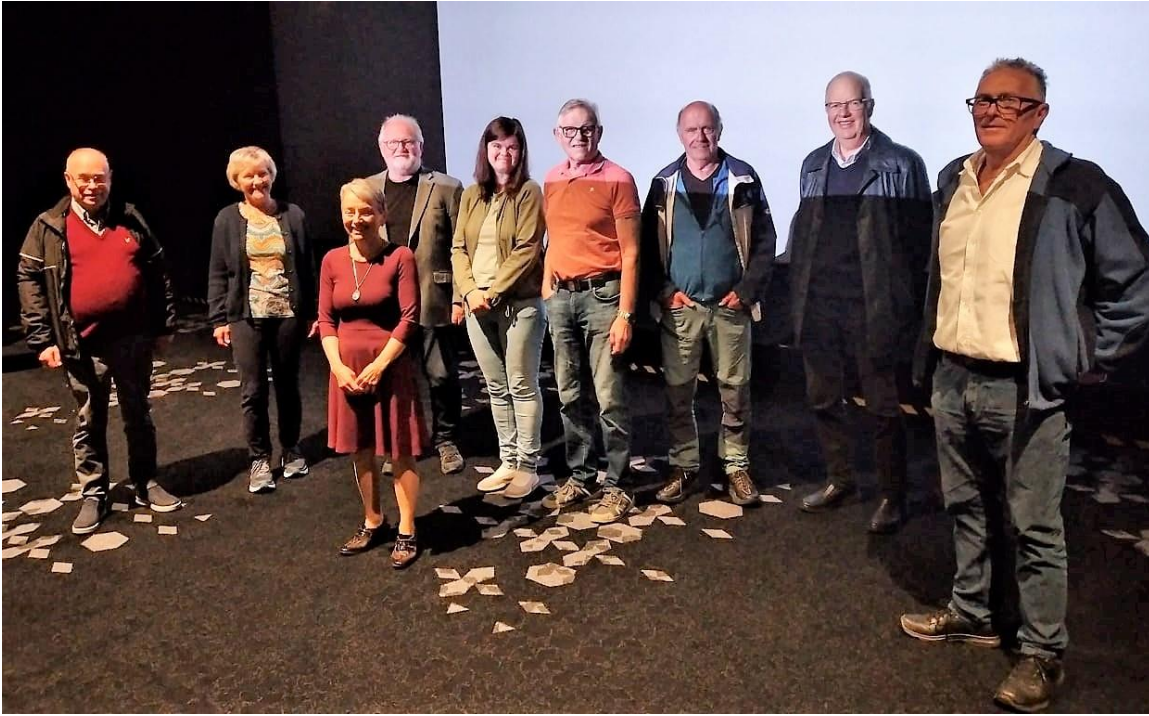
Bilete av det nye styret er tatt under årsmøtet den 25.5.2021.