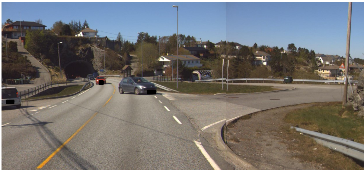
Figur 1 Bilde tatt 02.05.2017

tunnelopninga bidreg også til å forverre ein allereie uoversiktleg trafikksituasjon på staden. Med tett trafikk slik det normalt er til visse tider på døgnet vil merksemda til ein bilist som skal frå planområdet og i retning Straume i hovudsak være retta mot tunnelopninga og i mindre grad mot avkøyrsla som ligg vis a vis, på den andre sida av fylkesvegen (Fv. 561, h1, km, 4,704)