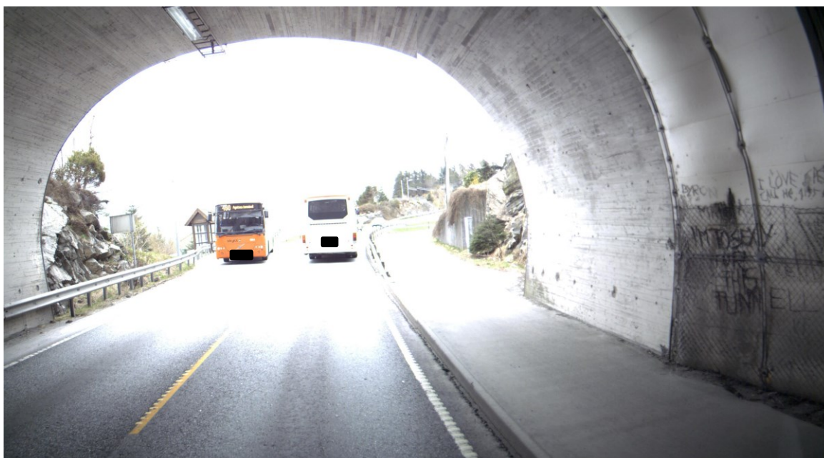
Figur 2 Bilde tatt 02.05.2018

Med bakgrunn i at tunellen ligg i kort avstand frå krysset som fører inn til planområdet vil faren for påkøyrslar bakfrå også være knytt til motgåande trafikk som reduserer farten for å svinge til venstre. Spesielt peiker vi på faren for at bilistar vert blenda av sollyset i det dei kjem ut av tunellen.