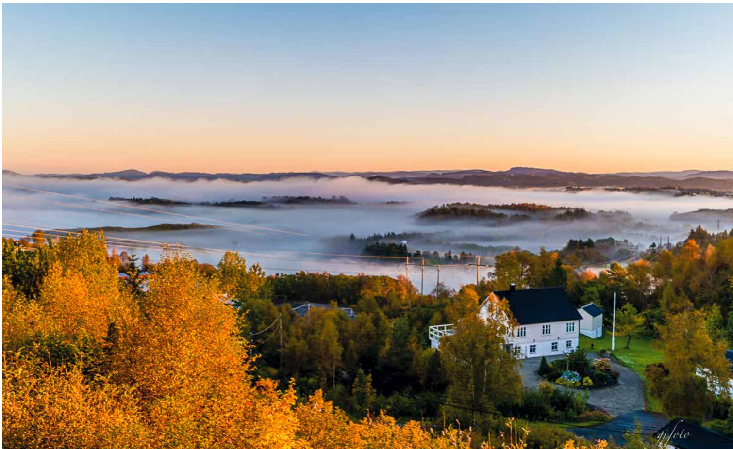
Utsikt mot Bildøyna/Foldnes, Fjell