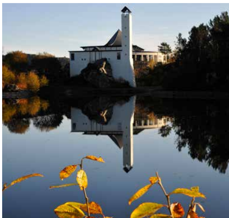
Foldnes kyrkje, Fjell