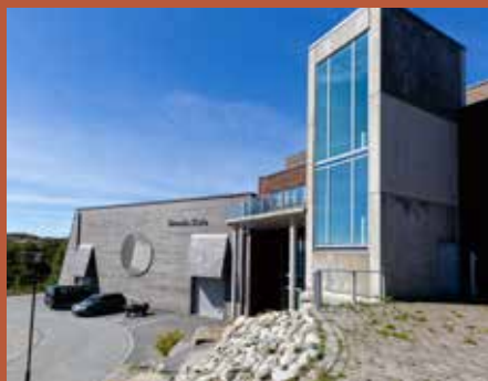
Stranda skule, Sund