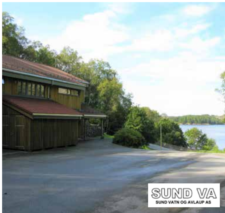
Kørelen vassverk, Sund

Samstundes skal det greiast ut, slik fellesnemnda har vedteke, kva for renovasjonsløysing som vert vald. Planen til prosjektrådmannen er altså å køyra begge prosessane samstundes (fusjon og konsekvensutgreiing om val av renovasjonsløysing).