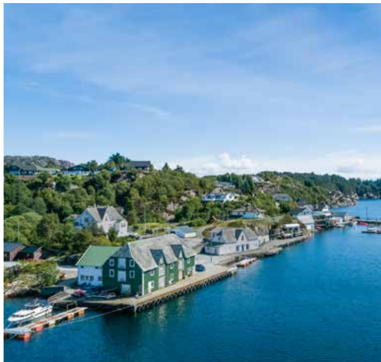
Steinsland kai, Sund