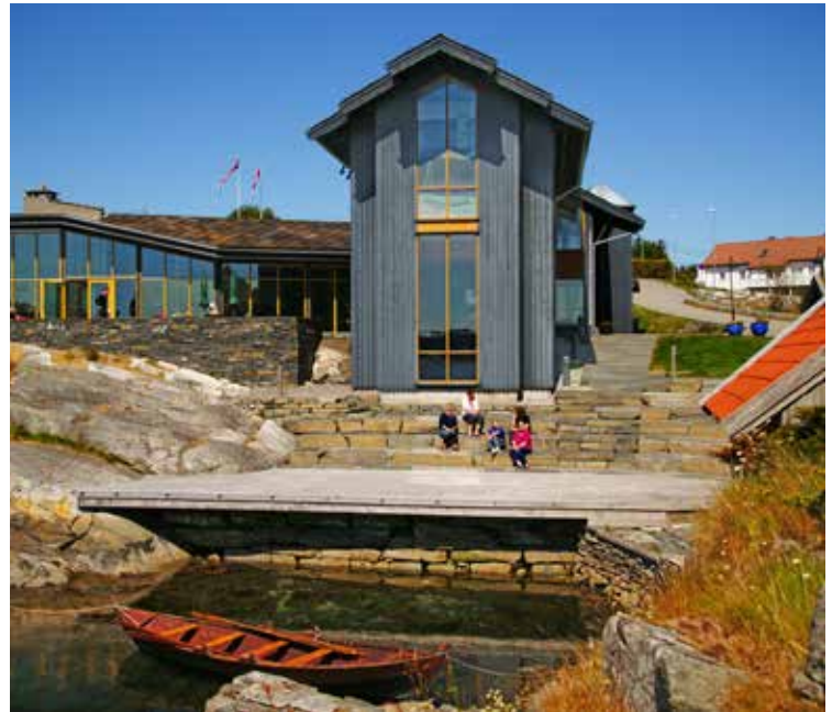
Kystmuseet på Oen, Øygarden