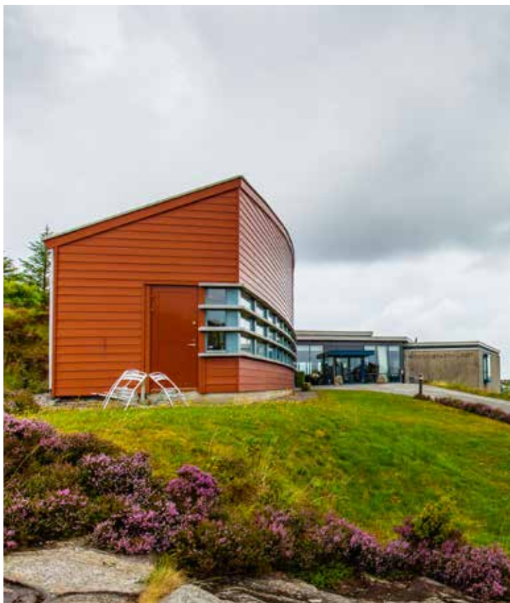
Nordsjøfartsmuseet i Telavåg, Sund

Slik prosjektoppbygging skapar oversikt, engasjement og produktivitet hjå prosjektdeltakarane. Prosjektleiar får god oversikt over ressursbehov, måloppnåing og framdrifta til prosjektet.