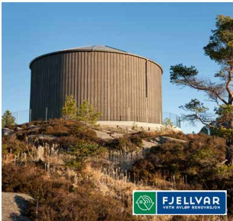
Vasstårnet på Bjørøyna, Fjell

Etter sommarferien har prosjektrådmannen hatt eit innleiande møte med leiinga og tilsettere representantar i FjellVAR AS og Sund VA AS. Jobben som skal gjerast, er å slå saman dei to selskapa i tråd aksjelova. Det var viktig å koma i gang med denne prosessen først.