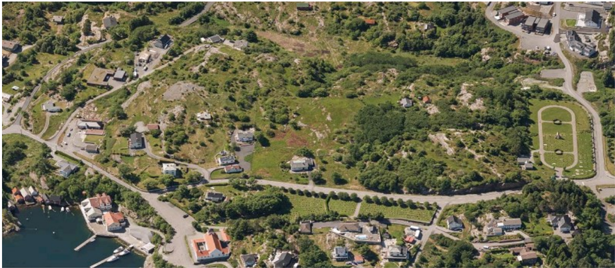
Sentral del av planområdet – skråfoto juli 2018