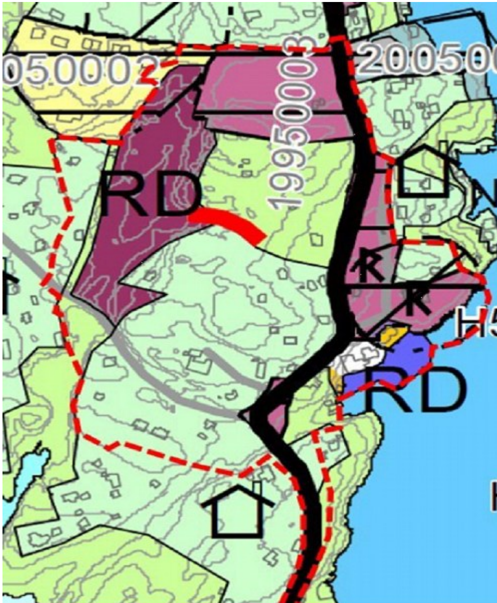
Utnytt av kommuneplankartet med innteikna plangrense (raud stipla strek)

Det vert planlagt for bustadbygging som ikkje er i samsvar med overordna plan, og områdeplanen fell med det inn under krav om konsekvensutgreiing.