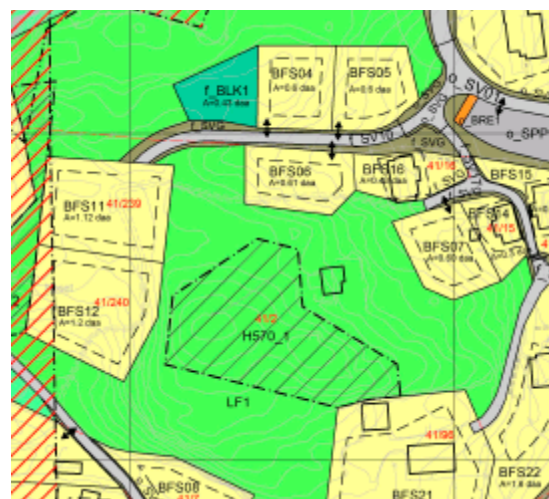
Utsnitt plankart ved høyring datert 16.05.19

-Bedehus er innarbeidd i kartet som bygg som skal utgå.