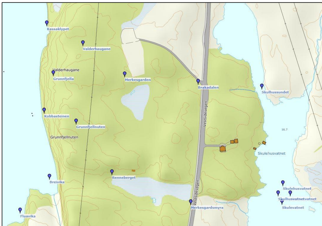
Illustrasjon viser namn frå Hordanamn

Merkesgardvegen/Merkjesgardvegen (iflg Hordanamn er stadnamnet Merkesgarden merkt like ved skulehustomta, men dette er feil. Merkesgarden ligg søraust for det nye bustadfeltet. Det er ein bergrygg som går i aust-vestleg retning. Uttalen har vore Merkjesgar'n ).