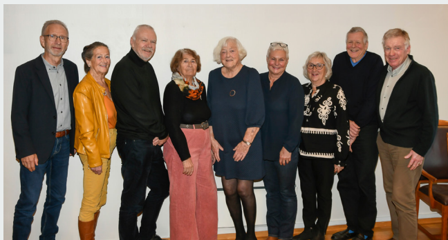
Eldrerådet 2023 - 2027.